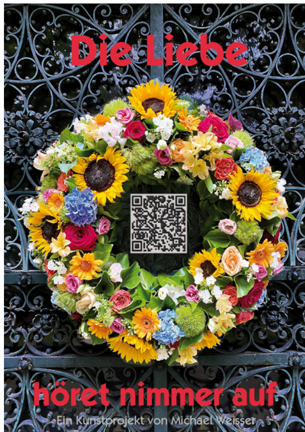
QR-Bildkarte als Schlüssel zum Projekt