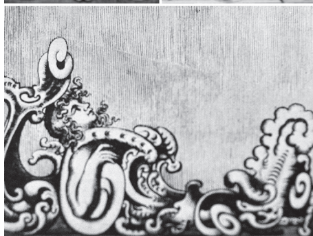
Abb. 11: Ornamentstiche von Friedrich Unteutsch (aus: Zülich , wie Anm. 83)

Der Hamburgische Bildhauer Christian Precht ließ sich wohl hauptsächlich von Unteutschs Vorlagen inspirieren. Einen gewissen Einfluss mögen auch die beiden »Compartimentenbücher« von Gotfried Müller (1620–1656) in Braunschweig gespielt haben, zumal auch Unteutsch die Braunschweiger Kirchenzierrate aus eigener Anschauung sowie Gotfried Müller persönlich gekannt haben wird. 84