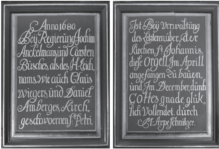
Abb. 3a–b: Die Inschriften- tafeln

letzten Jahrzehnte weitgehend ignoriert wurde. Deshalb wird an dieser Stelle näher auf die dort genannten Personen eingegangen.