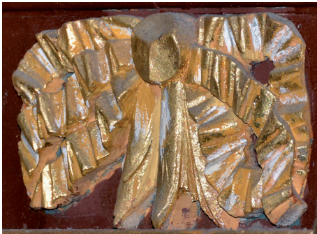
Abb. 10: Schleifenbandornament am Prospekt der Cappeler Orgel

Schärpe. 82 Die Schwanen-Ornamentik, die offenbar ohne direkte grafische Vorbilder geschaffen worden sind, können als Eigenschöpfungen des Bildhauers begriffen werden. Auch deshalb ist diese Ornamentik wahrscheinlich ein besonderer Bedeutungsträger im Zusammenhang des Elbschwanenordens und ihres Begründers Johann Rist.