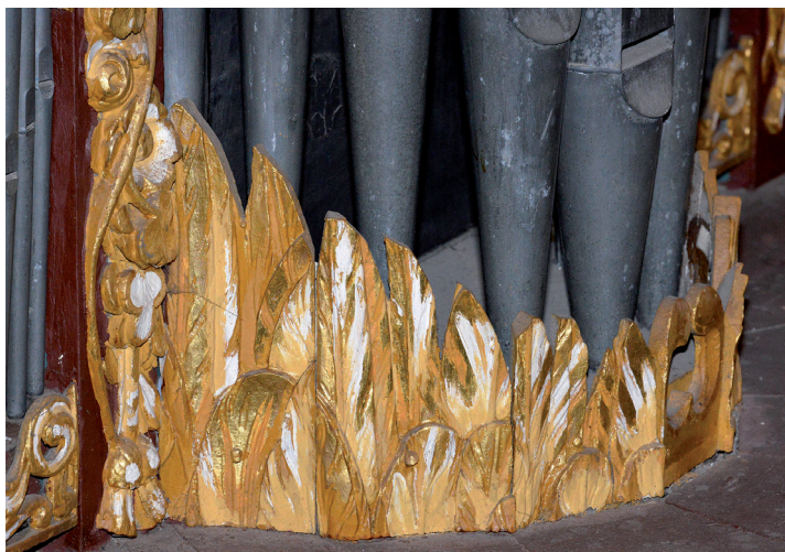
Abb. 14: Engelsflügel-Ornament

dem senkrechten Rahmenwerk. Man kann deutlich erkennen, dass die Schnitzerei mitten im Motiv abgesägt wurde. Es fehlen in dem Zierrat sowohl ein Blumengebilde wie auch der Abschluss der Kordelschnur. Die unteren Schleierwerke der Seitentürme stießen demnach, ästhetisch schöner, nicht gegen die großen Blumengebilde der Festons, sondern trafen auf die schmalen Kordelschnüre. Aus der Untersicht ist diese Kürzung kaum wahrnehmbar. Etwas Platz wurde auch gewonnen, indem der Mittelsteg zwischen den je zwei übereinander liegenden Flachfeldern verschmälert wurde. Die ursprünglich deutlich breiteren Mittelstege gliederten das Hauptwerk optisch sehr viel deutlicher.