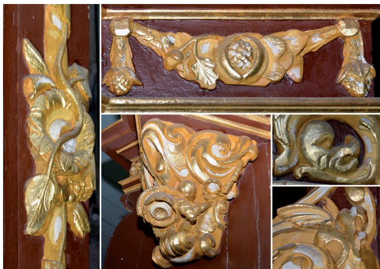
Abb. 6a-e: Exotische Pflanzen und Drachen

Das alles ist nicht nur Dekor, es ist auch Zeitansage eines betont lustvollen Zeitalters. Am Hauptprospekt sind die sechs vertikalen Rahmenstücke flächendeckend mit Blumengebunden verziert. Auf einer Grundstruktur von gebündelten Weidenruten, die von einer Weinranke umschlungen wird, sind in gleichmäßigen Abständen Frucht- und Blumenbouquets drapiert. Oben an einem geschnitzten Ziernagel mit Doppelschleifen befestigt, halten die umwickelnden Seidenschleifen das gesamte Gebinde zusammen. Der untere Abschluss fehlt leider wegen der Verkürzung des Hauptwerks. Auf den unteren Rahmenstücken der beiden Seitenfelder sind große Schleifenornamente angebracht. Sie zeigen ein vielfach gefaltetes, welliges Seidenband zu einer großen Doppelschleife gebunden. Oben sehen wir mittig einen Zierknopf, und nach unten ragen wie bei einer Brosche zwei Metallklammern. Auch hier muss der untere Teil des Ornaments als verloren gelten; er wurde ebenfalls bei der Einkürzung des Rahmenwerks abgesägt.