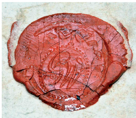
Abb. 13: Siegel von Orgelbauer Georg Wilhelm (Pfarrarchiv Cappel)

Die Schwierigkeiten für den Orgelbauer bestanden in der Höhenanpassung des Hauptwerks. Hier ist es Wilhelm gelungen, das Gehäuse an verschiedenen Stellen einzukürzen, ohne das technische Orgelwerk zu verändern. Kein einziges Register hat Wilhelm verändert. Auch die ursprünglich sechs Keilbälge aus Eichenholz hat er in Cappel wieder aufgestellt, ebenso die Windladen. Alle Schleifladen von Schnitger sind original an Ort und Stelle erhalten, dasselbe gilt für die Klaviaturen und Registerzüge, ebenso die Traktur im Hauptwerk. 135 Das ist in aller Kürze der Hauptgrund dafür, warum die Capper Orgel die am besten erhaltene Schnitger-Orgel überhaupt