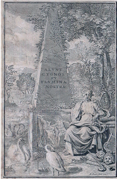
Abb. 9: Frontispiz der »Poesie der Niedersachsen«, B. Picart 1721