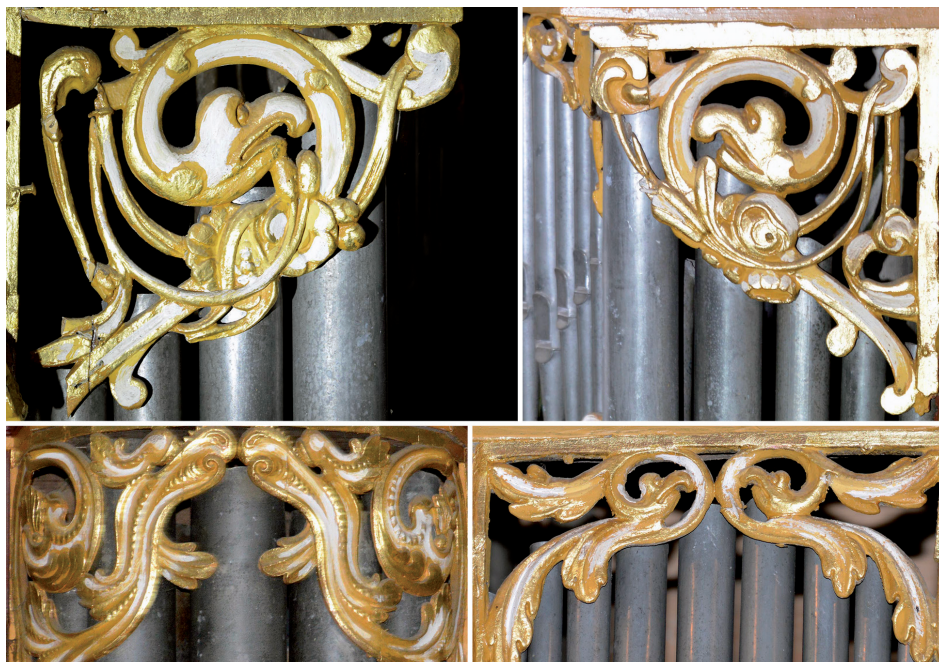
Abb. 8a–d: Schwanen-Schleierwerke

Die zehn oberen Schleier, die die Ecktürme und Seitenfelder einfassen und Füße und Köpfe der Pfeifenreihen verdecken, eint ebenfalls eine Thematik. Überall finden sich Schwanenhals-Ornamente, die in einem grotesken Schwanenkopf und Höcker-schnabel enden. Dargestellt ist ein Höckerschwan mit dem markanten höckerigen, leicht gebogenen Schnabel. Die größeren Ornamente an den Spitztürmen sind äußerst diffizil mit zoomorphen und floralen Elementen durchwirkt, Blumengebinde sind an Schleifen aufgehängt, Tücher sind über die Voluten drapiert; die kleinen Felder sind eingefasst mit gegenläufigen Schwanenhälsen. Lediglich der obere Schleier des Hauptturms wird von dem Motiv geflügelter Drachen dominiert. Sie erscheinen dem Triumphator, der über ihnen stand, unterworfen zu sein. Die Basisschleier der Ecktürme sind als stark bewegtes Rankenwerk gestaltet, wie die des Rückpositivs. Noch diffiziler ist das Schwanen-Schleierwerk am Rückpositiv an den zwei unterschiedlich gearbeiteten Mustern der wiederum acht Schleier. Hier zeigt der Bildschnitzer seine ganze Kunstfertigkeit in der Gestaltung der Mischwesen.