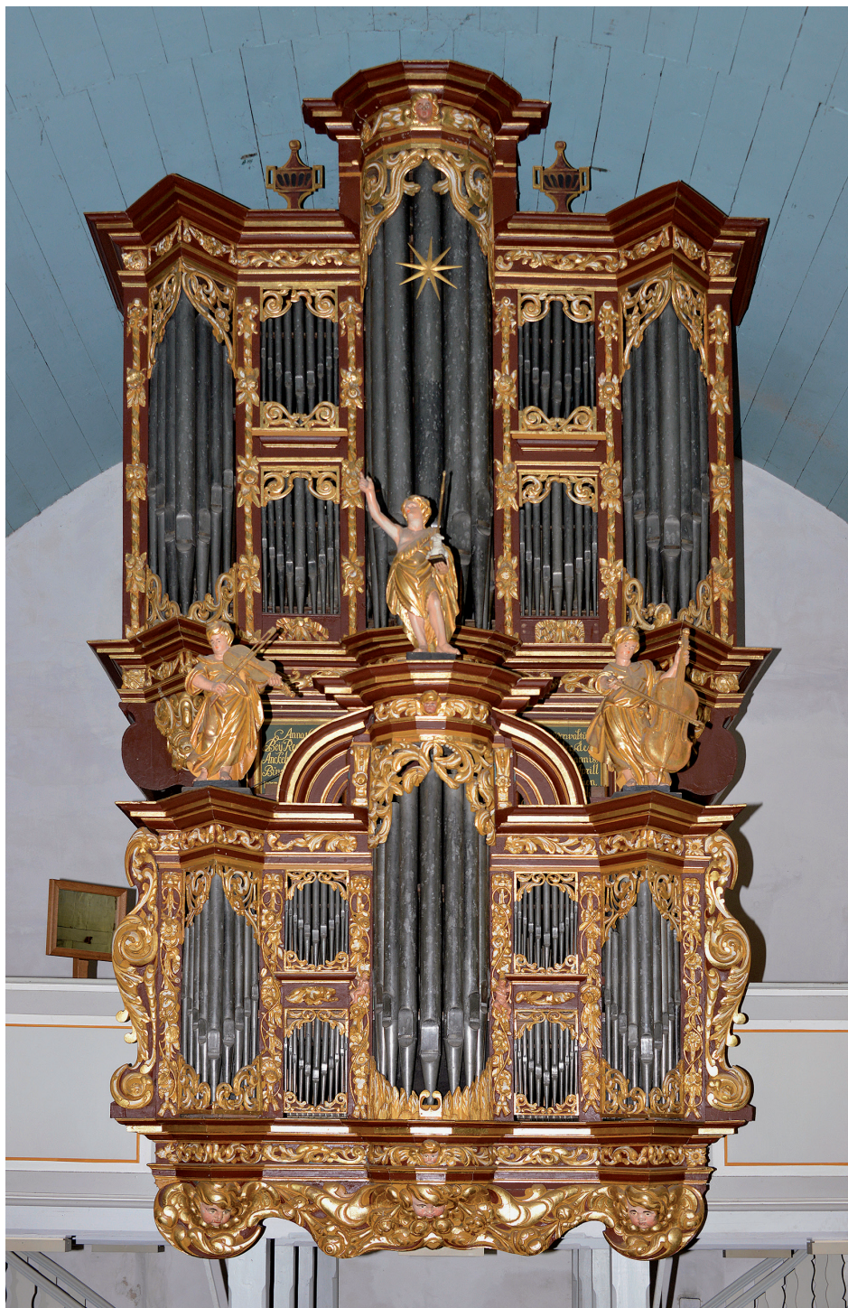
Abb. 1: Gesamtansicht der Cappeler Orgel