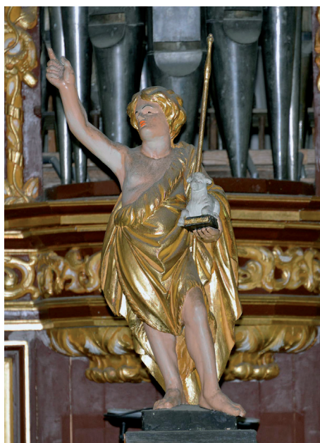
Abb. 4a–b: Jugendlicher Johannes der Täufer (unten) und Christus