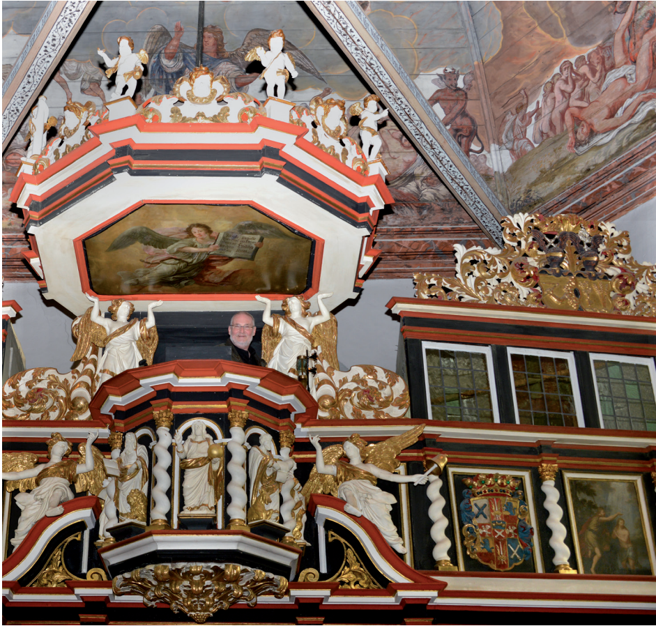
Abb. 12: Prechts Kanzelaltar von 1688 und Schnitgers Kirchenstuhl

daß der Orgelbauer Arp Schnitger die Anregung zu einem solchen Altarwerk gegeben hat. Schnitger, gleichzeitig mit Precht in Neuenfelde tätig und seit langem mit ihm persönlich bekannt, wurde offenbar bei den Planungen zu Rate gezogen, denn er war Ende Mai und Anfang Juni 1688 mit dem Propsten v. Finckh unterwegs, um die Kanzeln in Stade und Harburg zu besichtigen. Vielleicht hat er im Zusammenhang mit seiner, allerdings erst ab 1689 belegten Tätigkeit in Sachsen von der Idee des Kanzelaltars gehört und einen solchen Bau in Neuenfelde angeregt. Bedenkt man außerdem, daß Precht sicherlich auf ein Vorbild für den Gesamtaufbau des Kanzelaltars angewiesen war, so kommt am ehesten Arp Schnitger als Berater und Helfer beim Herstellen des Entwurfs in Frage, denn er besaß durch den Orgelbau Erfahrungen, die hier von Nutzen gewesen sein könnten. [...] Ein solches organisches Architekturgebilde zu entwerfen, das nicht in gleicher Weise wie ein selbständiges Retabel an Formtraditionen gebunden ist, mag man dem mit wenig eigener Erfindungsgabe und Sinn für räumliches Gestalten ausgestatteten Bildschnitzer Precht nicht zutrauen, wohl aber dem Orgelbauer Arp Schnitger, dessen zahlreiche Werke beweisen, daß er eine