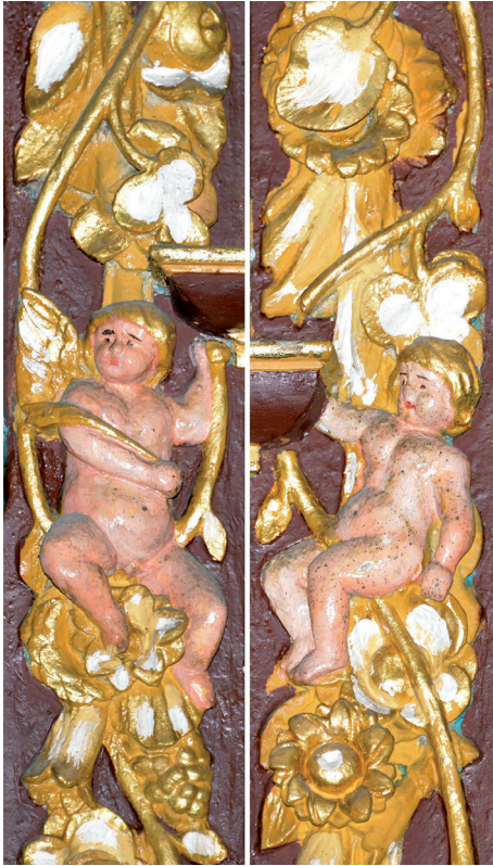
Abb. 7a–b: Eroten im Schlingwerk

dem Täufer Johannes und dem krönenden Salvator, umgeben von einem Himmelsorchester. In der Nahtsicht offenbart sich allerdings eine sinnenfreudige Welt. 64 Die vielen verschiedenen exotischen Gewächs- und Blumenarten, die zu dieser opulenten, sinnenfreudigen, erotischen Fülle komponiert sind, könnte schon als eine künstlerische Hommage an den berühmten Anckelmanschen Barockgarten verstanden werden. Zumal ein Angehöriger der einfluss- und geldreichen Familie Anckelmann den Orgelbau im St. Johannis-Kloster hauptverantwortlich mit veranlasst hatte.