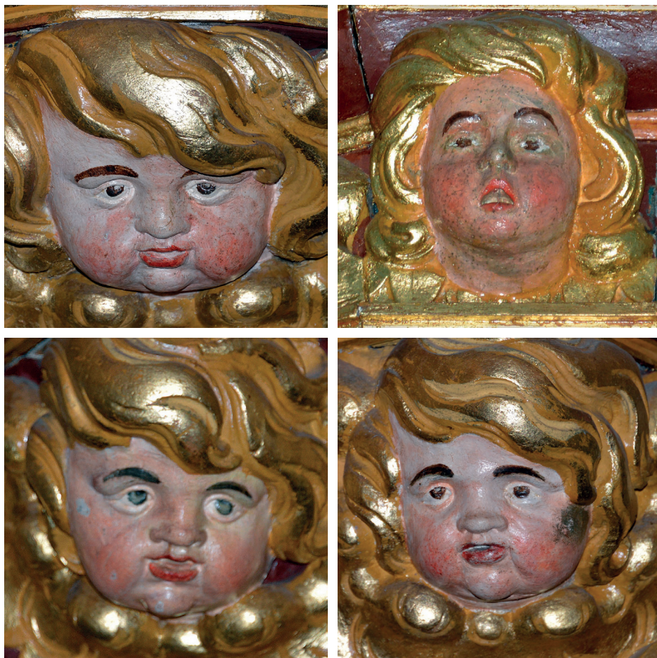
Abb. 5a–d: Vier Engelsköpfe aus dem Unterzug

und musischer Förderer des jungen Komponisten Georg Philipp Telemann, dem späteren Kantor am Johanneum, und er pflegte eine jahrelange Freundschaft mit Arp Schnitger, den er dann mit dem Orgelbau beauftragte. 62 Von welchem Auftraggeber das außergewöhnliche Schmuck- und Figurenprogramm der Johanniskirchen-Johanneums-Orgel stammt, ist leider nicht zu ermitteln. Diese Komposition gehört mit der Clausthal-Zellerfelder zu den interessantesten Hamburger Orgelprospekt-Arbeiten des Barockzeitalters. Zudem ist das reiche ornamentale Dekor zu ca. 95 % original erhalten. Es fehlen lediglich die beiden großen seitlichen Ornamente am Hauptwerk, sie sind aber durch interessante zeitgenössische illusionistisch bemalte Sägearbeiten ersetzt. Die Schleierwerke des Mittelturms am Rückpositiv sind verloren gegangen. Das untere Ornament ist die Wiederverwendung der Flügelfragmente, während