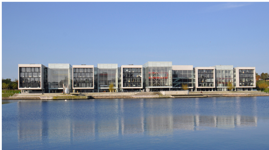
Der »Alsion-Campus«

Abbildungen, zum Abdruck frei (Höhere Auflösung bitte anfordern)