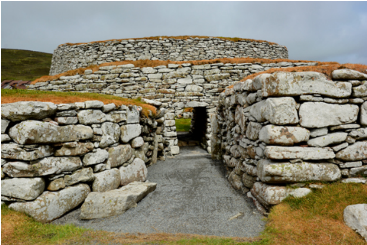
Im Clickimin Broch, Shetland Islands

Doch dieses „Atelier“ ist nicht mein einziger „Raum“, an dem ich arbeite. Weitere Räume sind Straßencafés, bei denen ich mitten im Treiben der Stadt sitze und mich von der Atmosphäre innen oder außen inspirieren lasse. Ich lese, esse, sehe mich um, trinke Kaffee, höre in das Rauschen der vorbeilaufenden Stimmen und denke nach. Hier entstehen meist die Konzepte und Skizzen, die ich später im Atelier in Ruhe ausarbeite. Den dritten großen „Raum“ bieten meine jährlichen Reisen an ferne, oft exotische Orte. Auf diesen Reisen beschäftige ich mich mit „Ästhetischen Feldforschungen“, bei denen ich Fotos und Klänge aufzeichne, das betrifft meine künstlerische Arbeit.