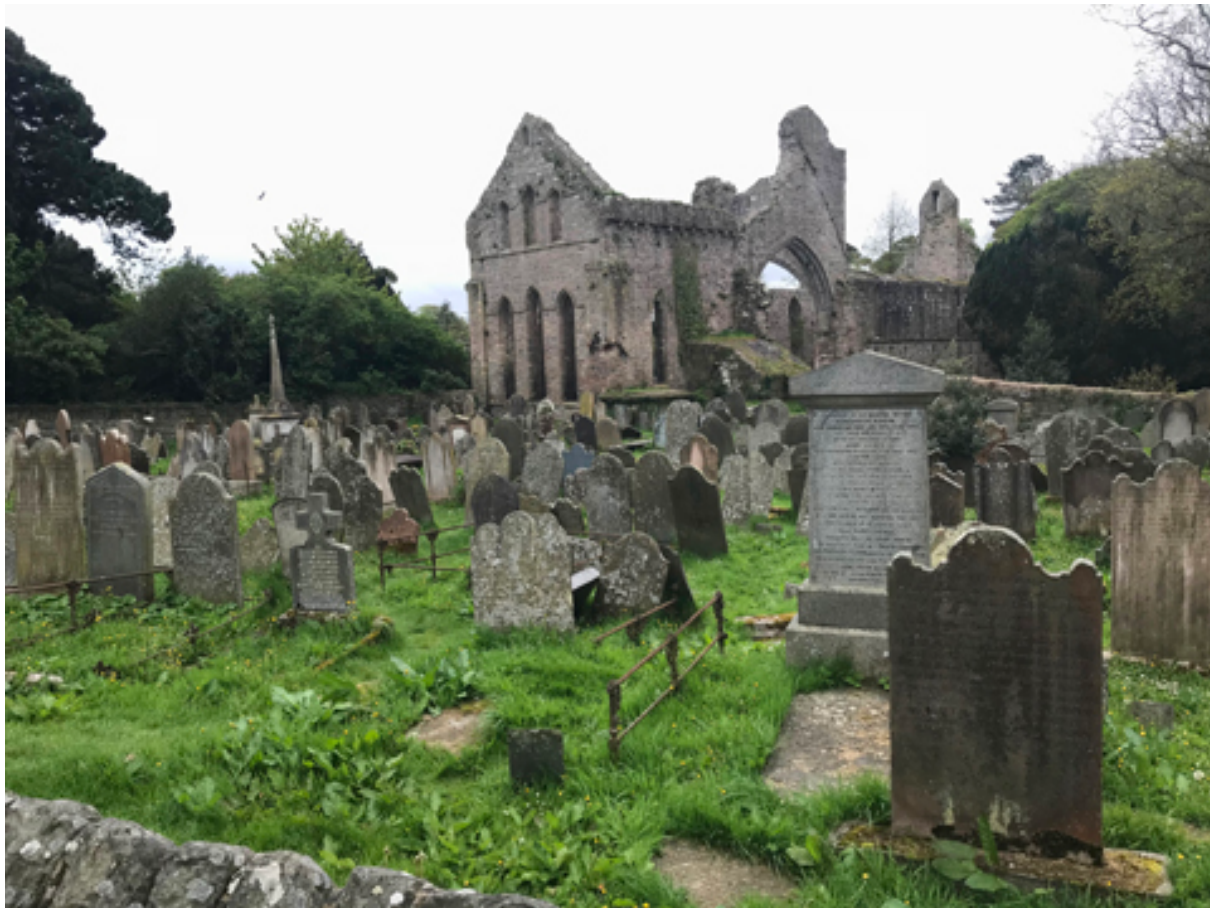
Im Greyabbey Cemetery, Nordirland

Aber auch Reisen durch fremdes Land an fremde Orte wirken ebenso inspirierend wie Reisen durch mein Alltagsleben, das ich ständig mit anderen Augen sehen und erleben kann... und bei allem Sehen darf man das Hören und auch das Riechen nicht vergessen.