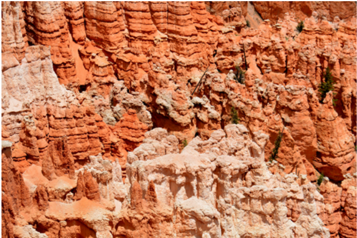
Im Bryce Canyon, Utah

Das Besondere dieses Ortes mag seine Überfüllung mit Objekten sein, die man in der Kunst "Trouvés" nennt, die als Erinnerungsstücke auf mich anregend wirken und ständig zu neuen Verknüpfungen inspirieren. Wer mich besucht äußert oft, all dies anregend zu empfinden aber unter dieser Fülle der Eindrücke vor lauter Ablenkung nicht arbeiten zu können.